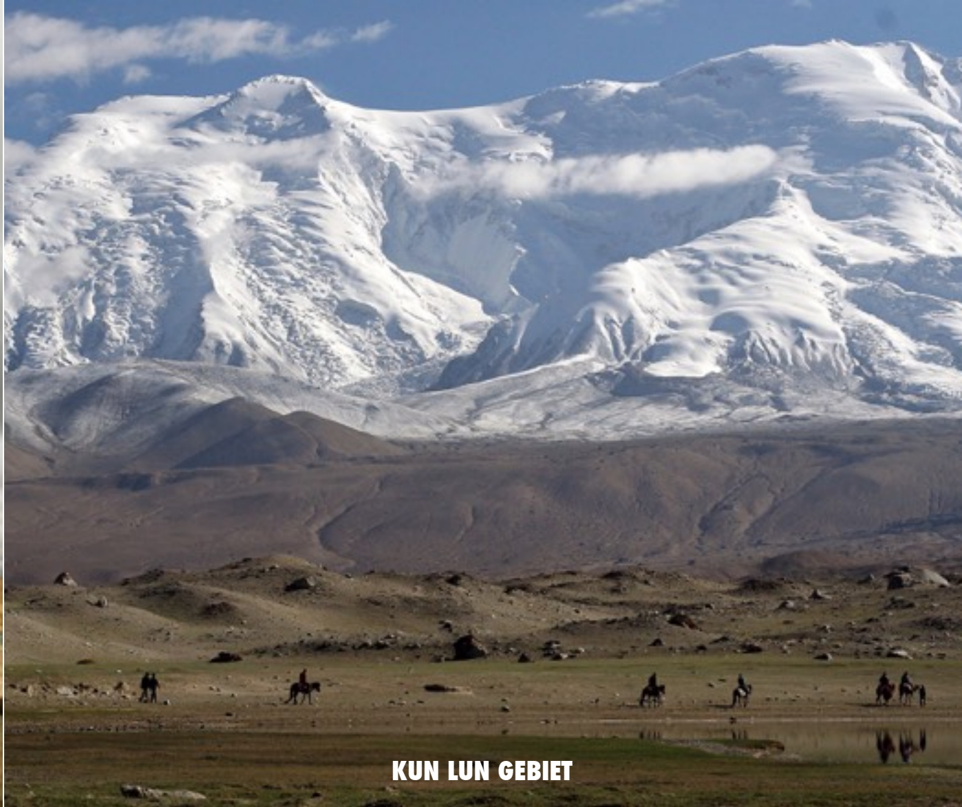
KUN LUN GEBIET