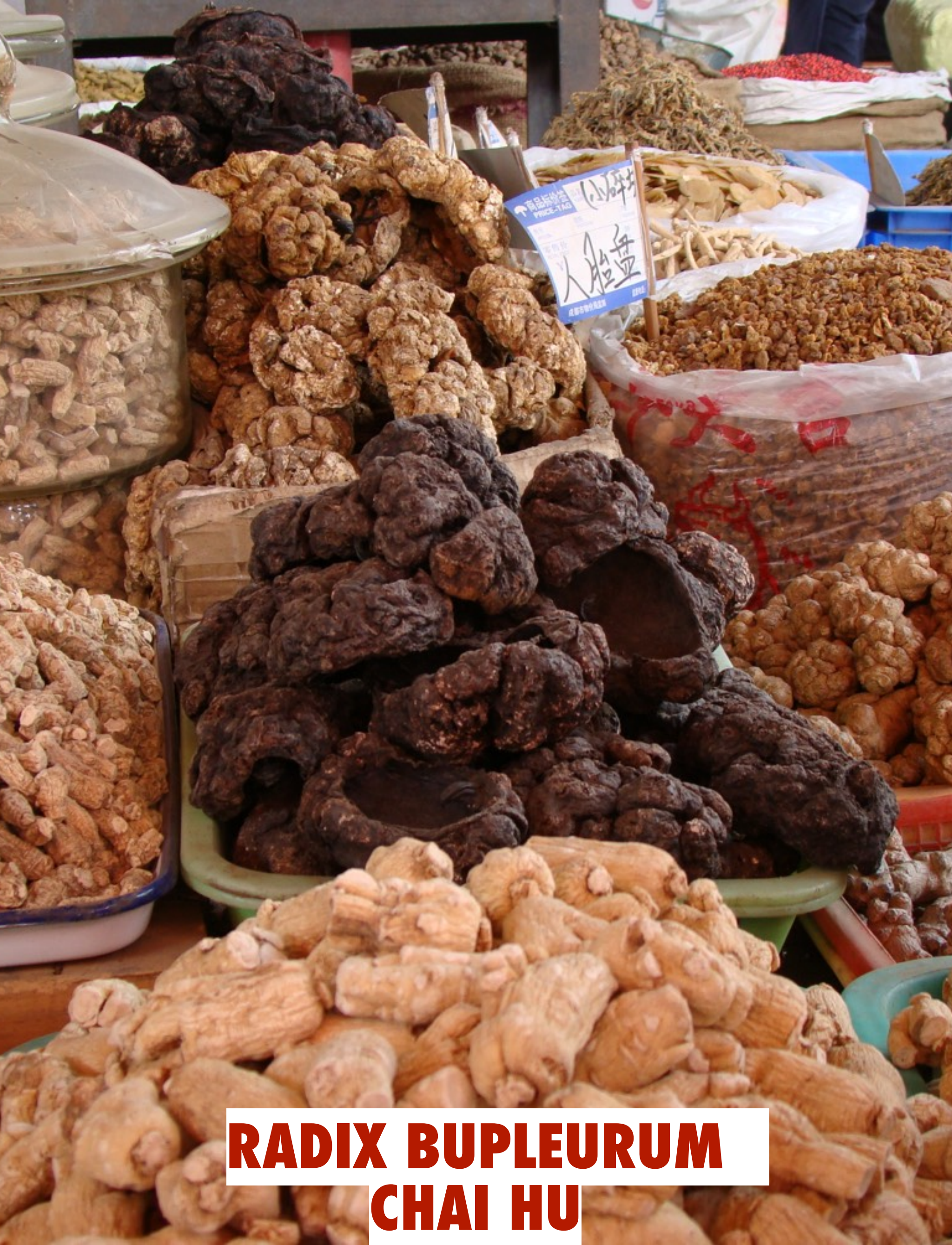
RADIX BUPLEURUM CHAI HU